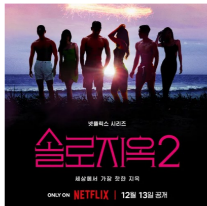
<피지컬: 100>, <솔로지옥 2> 포스터