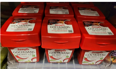
벨기에 마트 샘표 고추장 매대

겐트 내 프랜차이즈 슈퍼마켓(알베르트헤인 Albert Hein)에서 고추장 판매 시작. 한국 라면, 김치, 불고기, 김에 이어 K-푸드 상품의 다양화 양상 확인