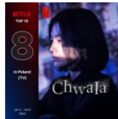
폴란드 넷플릭스 8위에 오른 <더 글로리(Chwała)>

* 폴란드 넷플릭스 톱10( https://top10.netflix.com/poland/tv?week=2023-01-08 )