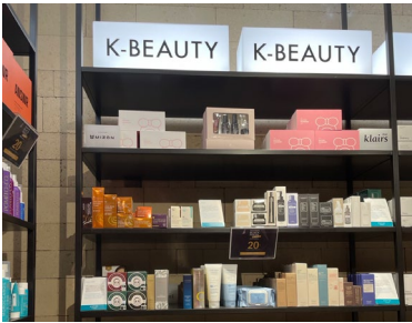
피렌체 세포라 매장에 전시된 한국 화장품