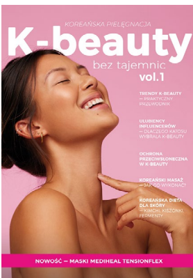
헤베가 발행한 전자책 'K-beauty' 1호 ( https://www.hebe.pl/ )

* 헤베(hebe): 2011년 바르샤바에 첫 지점을 연 드럭스토어. 폴란드 전국 290여 개의 오프라인 드럭스토어와 함께 온라인 드럭스토어를 운영. 약 800개에 이르는 한국 화장품을 판매