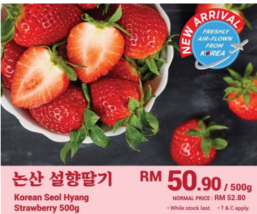
케이플러스마켓에서 판매한 논산 설향딸기 광고

* 케이플러스마켓(K-Plus Market): 약 800평 규모의 1호점은 슬랑오르주(Selangor)의 더 커브 쇼핑몰에 위치('22.10.). 2호점 개장 예정