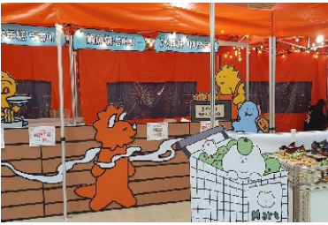
K-FEVER 매력한국축제 현장