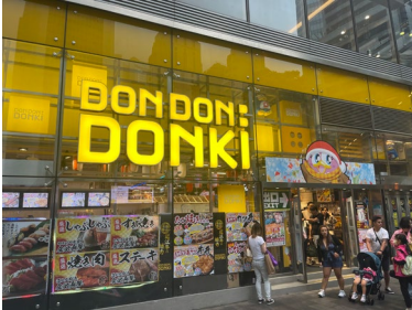
홍콩에 위치한 일본의 대형 매장 '돈돈돈키'