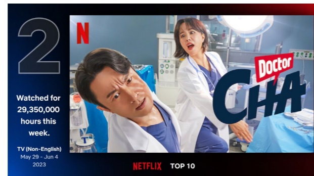
넷플릭스 TOP 10 TV(비영어) 부문 2위에 오른 <닥터 차정숙> (넷플릭스, https://me2.kr/bhuBu )

*플릭스패트롤( https://flixpatrol.com/top10/netflix/taiwan/2023-05/ )