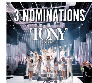
제76회 토니어워즈 3개 부문(음악상, 의상상, 안무상) 후보에 오른 뮤지컬 <KPOP>