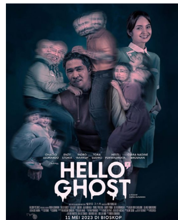
2023년 개봉한 한국 영화 리메이크작 <Scandal Makers>와 <Hello Ghost>