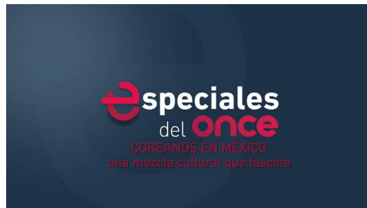
스페셜 프로그램 <멕시코의 한인, 매력적인 문화적 혼합(Coreanos en México, una mezcla cultural que fascina)> (Canal Once)

국영방송 11번 채널(Canal Once)에서 스페셜 프로그램 <멕시코의 한인, 매력적인 문화적 혼합(Coreanos en México, una mezcla cultural que fascina)>을 방영(5.10.). 해당 프로그램은 ‘소프트파워(Poder Blando)’를 언급하면서 “케이팝을 중심으로 꾸준히 성장한 한류의 경제적 파급효과”를 분석. 반면 연예인의 브랜드평판이 일정 수준에 도달하면 해외 기획사로 소속을 옮기는 멕시코 엔터테인먼트산업의 구조를 지적