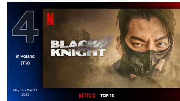
2주 연속 폴란드 넷플릭스 4위에 오른 <택배기사>

동명의 인기 웹툰을 원작으로 한 드라마 <택배기사>, 5월 12일 넷플릭스에서 공개되자마자 2주 연속(5.8. ~ 21.) 폴란드 넷플릭스 TV 프로그램 부문 4위 기록. 특히 시각효과에 대한 현지 호평이 이어짐