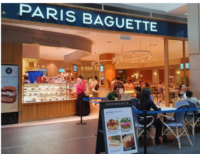
말레이시아에 진출한 파리바게뜨