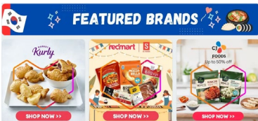
레드마트에서 선보인 '코리아 페어(Korea Fair)' (라자다 그룹(Lazada Group))

라자다 그룹(Lazada Group)의 온라인 식품 플랫폼 레드마트(redmart)는 '코리아 페어(Korea Fair)'를 통해 마켓컬리, CJ제일제당의 상품을 선보임. 3.03SGD(약 3,100원)에 판매 중인 '비비고 한식 간장 김자반(50g)', 5.31SGD(약 5,500원)에 판매 중인 '비비고 핫바삭김 재래김(4gX12봉)'은 싱가포르 내 K-푸드 열풍을 타고 베스트셀러로 꼽힘