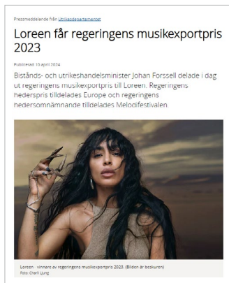
정부 음악수출상을 수상한 스웨덴 아티스트 로린(Loreen)

* 27번째 ‘정부 음악수출상’ 후보에는 로린(Loreen) 외 일리아 살만자데(Ilya Salmanzadeh), 마르틴 프로스트(Martin Fröst), 비아그라 보이즈(Viagra boys), 자라 라르손(Zara Larsson)이 오름