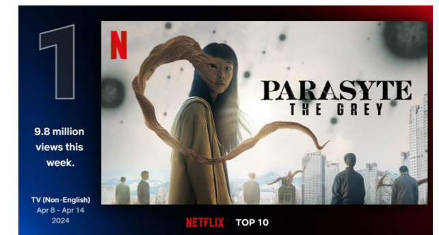
넷플릭스 TOP 10 TV(비영어) 부문 1위 <기생수: 더 그레이> (넷플릭스, https://www.netflix.com/tudum/top10/tv-non-english?week=2024-04-14 )