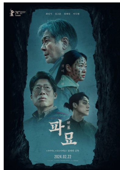
영화 <파묘> 포스터 (쥬쇼박스, 쥬파인타운 프로덕션)

*박스오피스모조( https://www.boxofficemojo.com/weekend/2024W17?area=AU&ref_=bo_we_nav )