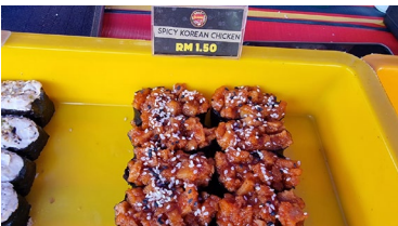
라마단 바자회(Ramadan Bazaar)에서 판매하는 '한국 양념치킨'

* 라마단(Ramadan, 이슬람력 9번째 달): 무슬림 5대 의무 중 하나로, 선지자 모하메드가 코란의 첫 계시를 받은 것을 기념해 해가 떠 있는 동안 금식하며 자선과 관용을 실천하는 달 (*24.3.11. ~ 4.10.)