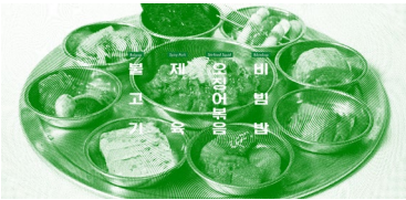
뉴욕에 문을 연 '백반 전문 기사식당(Kisa)' (Kisa 홈페이지, https://www.kisaus.com/ )

Kisa (Korea's International South Korean Restaurant) is a restaurant in New York City that serves traditional Korean roadside food. It is located in the Lower East Side neighborhood of Manhattan. The restaurant is known for its affordable prices and authentic Korean cuisine. It is a popular spot for locals and tourists alike.