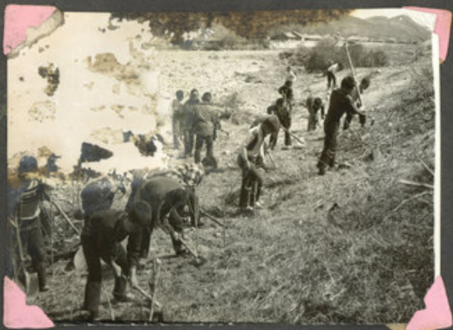
28회 식목일기념식수 (포플러 1000본)