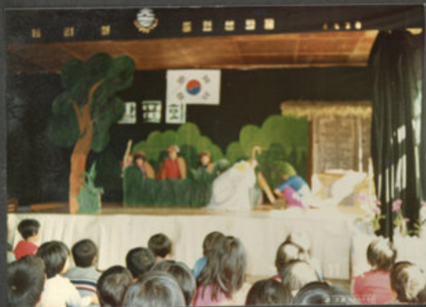
83.11.11. 학예발표회 (동극)