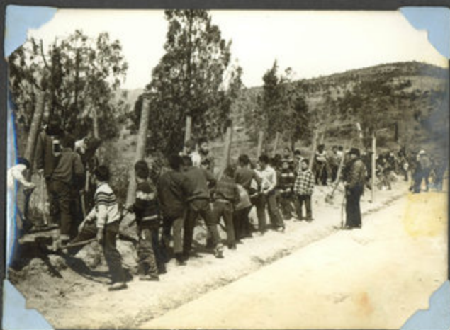
생울타리 보식 작업