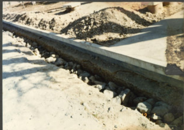
83.12.1 지하배수구 150m 완공