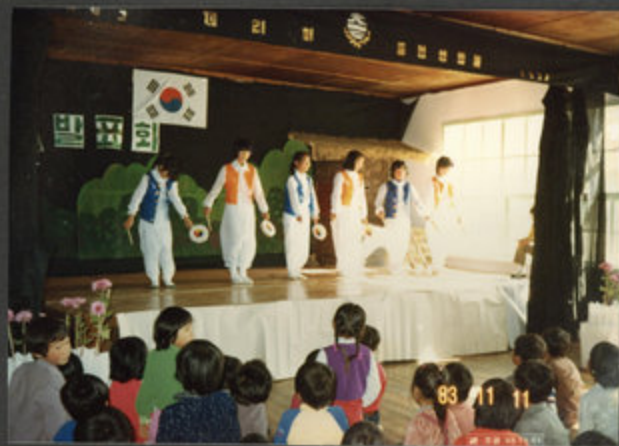
83.11.11. 학예발표회 (소고춤)