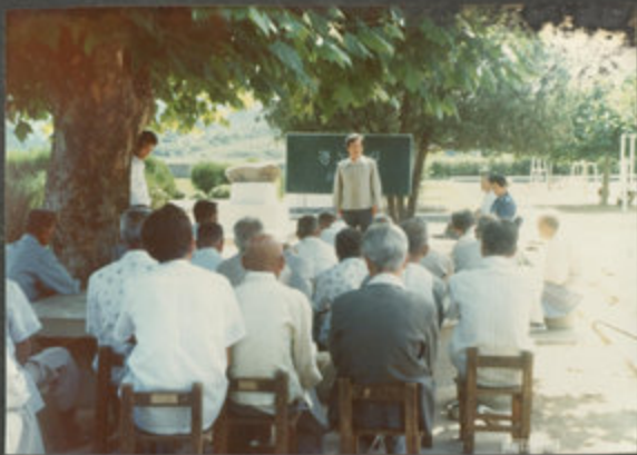
84.5.10. 경노교실 운영