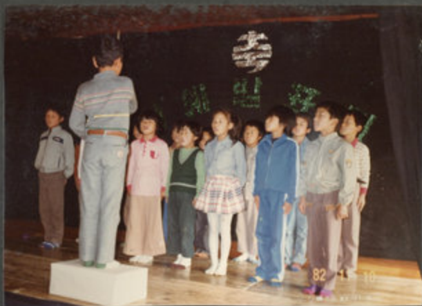
82.11.10 학예발표회 (합창)