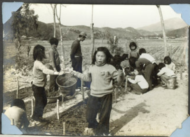
120 삽목 광경