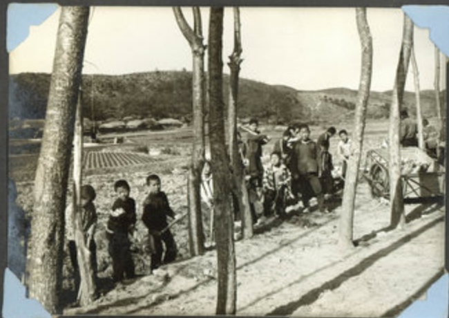
하수구 정리 작업