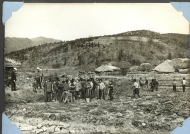
73 조립 속성포를 삽목 준비 작업